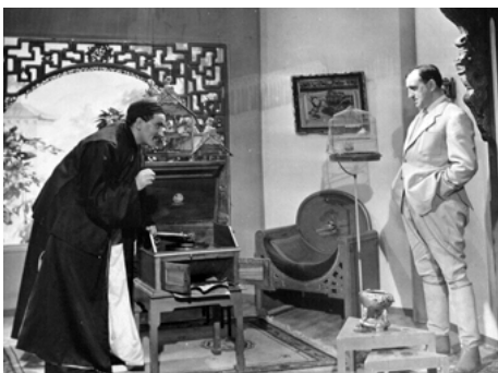
1938 LES PIRATES DU RAIL de Christian-Jaque avec Charles Vanel