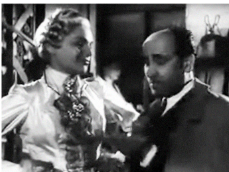
1948 IMPASSE DES DEUX-ANGES de Maurice Tourneur avec Simone Signoret