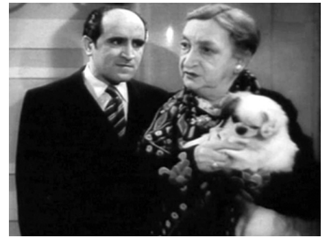
1939 LE CHÂTEAU DES QUATRE OBÈSES d'Yvan Noé avec Marguerite Moreno