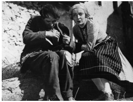
1934 RAPT de Dimitri Kirsanoff avec Dita Parlo