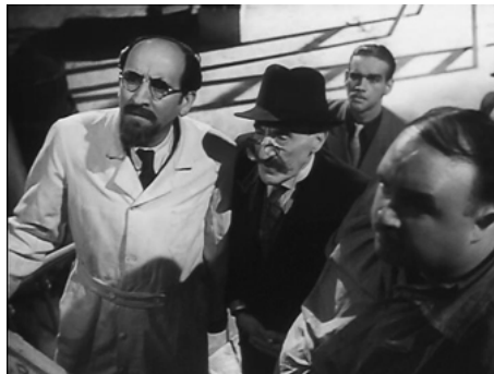
1947 PANIQUE de Julien Duvivier avec Guy Favières, Max Dalban