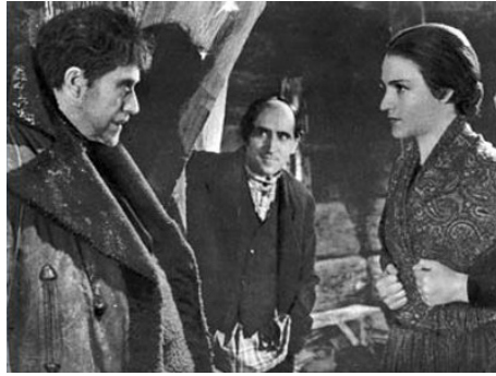
1937 TAMARA LA COMPLAISANTE de Félix Gandéra avec Victor Francen, Régine Poncet