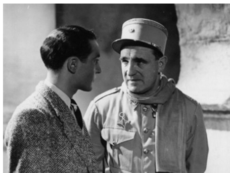
1938 BAR DU SUD d'Henri Fescourt avec Charles Vanel