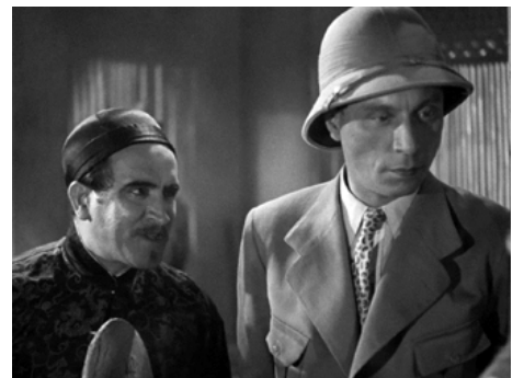
1937 FORFAITURE de Marcel L'Herbier avec Louis Jouvet