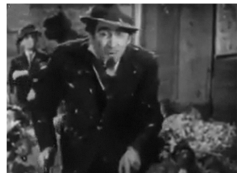
1951 BIBI FRICOTIN de Marcel Blistène