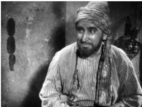
1939 YAMILÉ SOUS LES CÈDRES de Charles d'Espinay