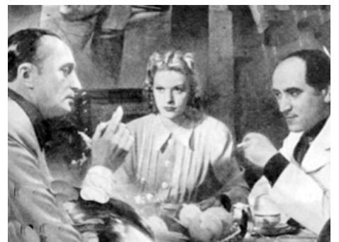
1938 TEMPÊTE SUR L'ASIE de Richard Oswald avec Conrad Veidt, Madeleine Robinson