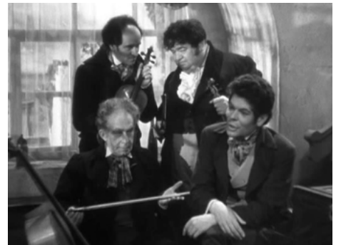
1937 UN GRAND AMOUR DE BEETHOVEN d'Abel Gance avec André Nox, Pierre Pauley, Roger Blin