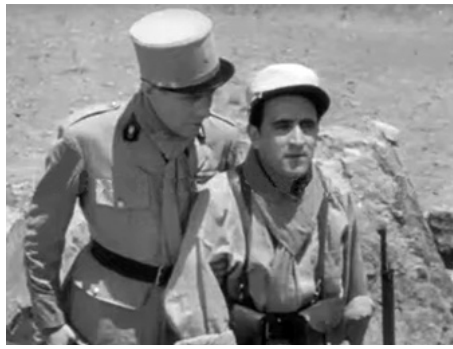
1939 LE CHEMIN DE L'HONNEUR de Jean-Paul Paulin avec Roland Toutain