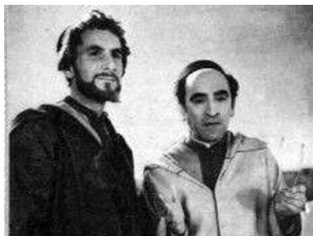
1948 LA ROUTE INCONNUE de Léon Poirier avec Robert Darène