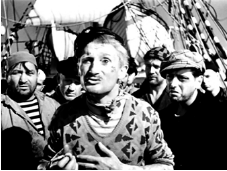
1936 LES MUTINÉS DE L'ELSENEUR de Pierre Chenal avec Robert Le Vigan