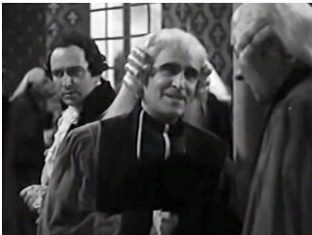
1946 L'AFFAIRE DU COLLIER DE LA REINE de Marcel L'Herbier avec Jean-Louis Dallibert