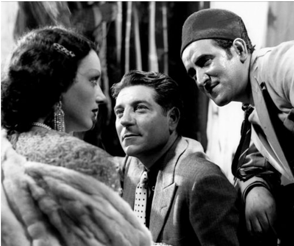
1937 PÉPÉ LE MOKO de Julien Duvivier avec Mireille Balin, Jean Gabin