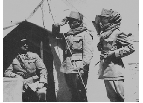
1937 LES HOMMES SANS NOM de Jean Vallée avec Jean Marchat